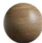
Melamina Mod "Copal"