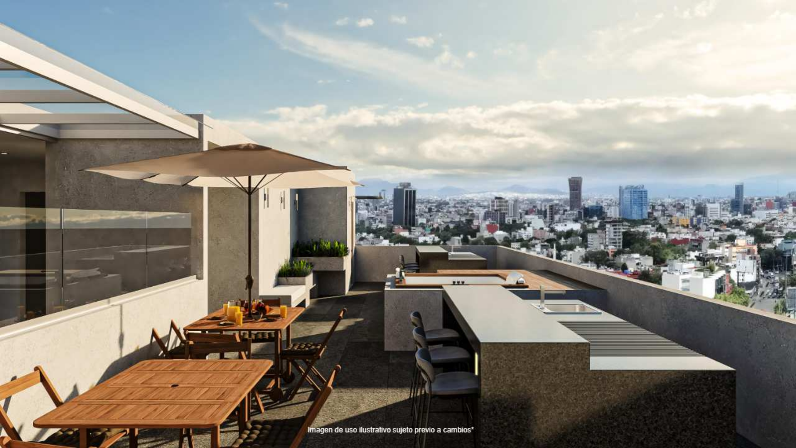
Imagen de uso ilustrativo sujeto previo a cambios*