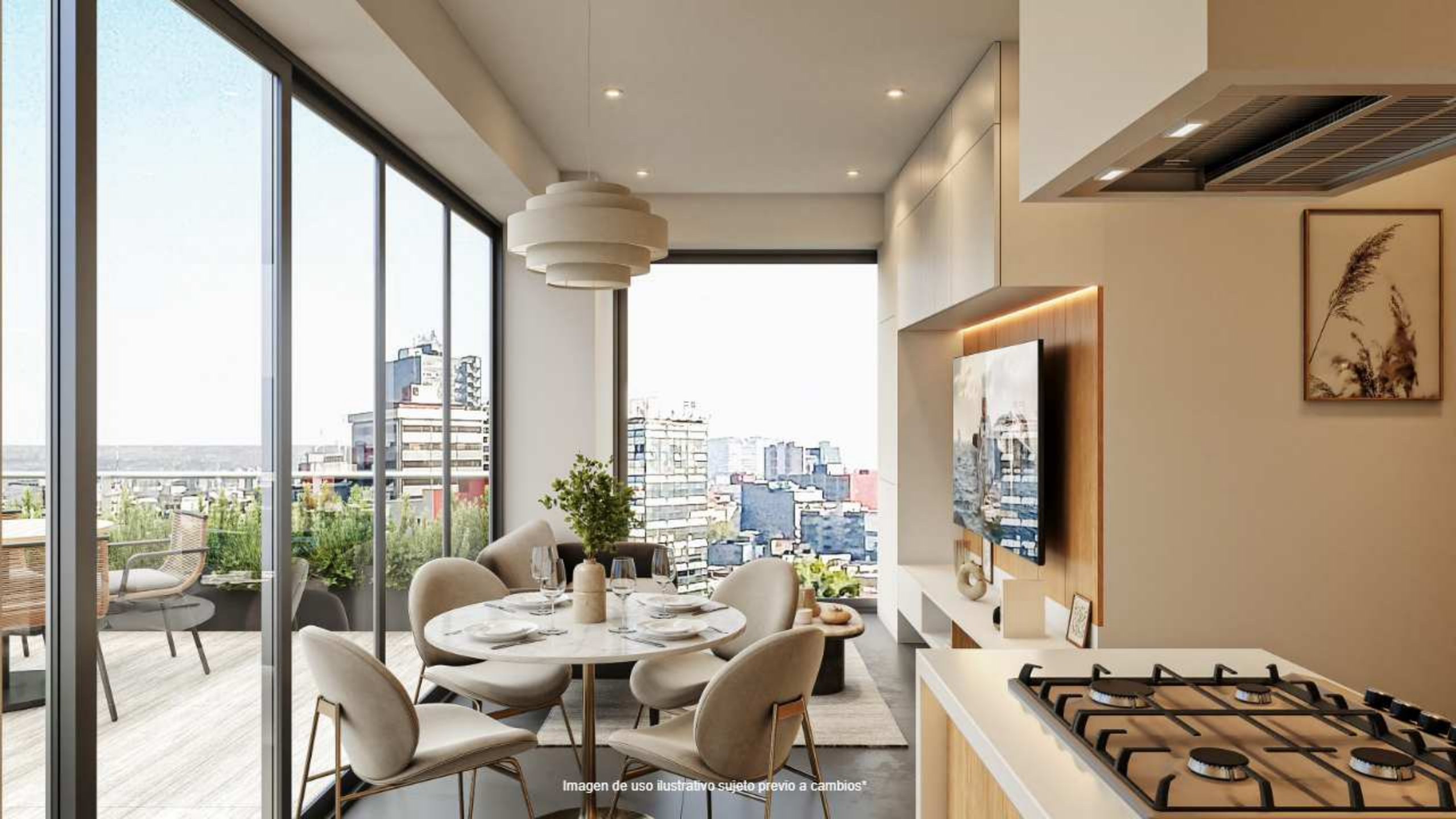
Imagen de uso ilustrativo sujeto previo a cambios*