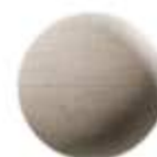
Mármol en Cocinas y Baños