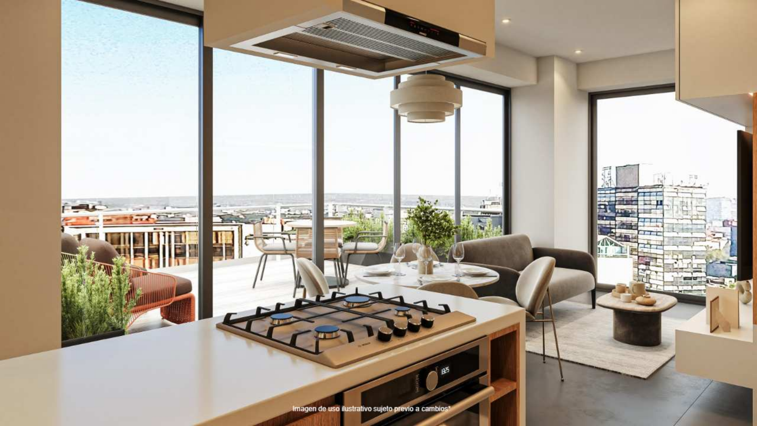
Imagen de uso ilustrativo sujeto previo a cambios*