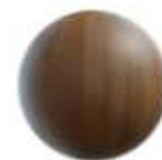
Piso SPC en recámaras