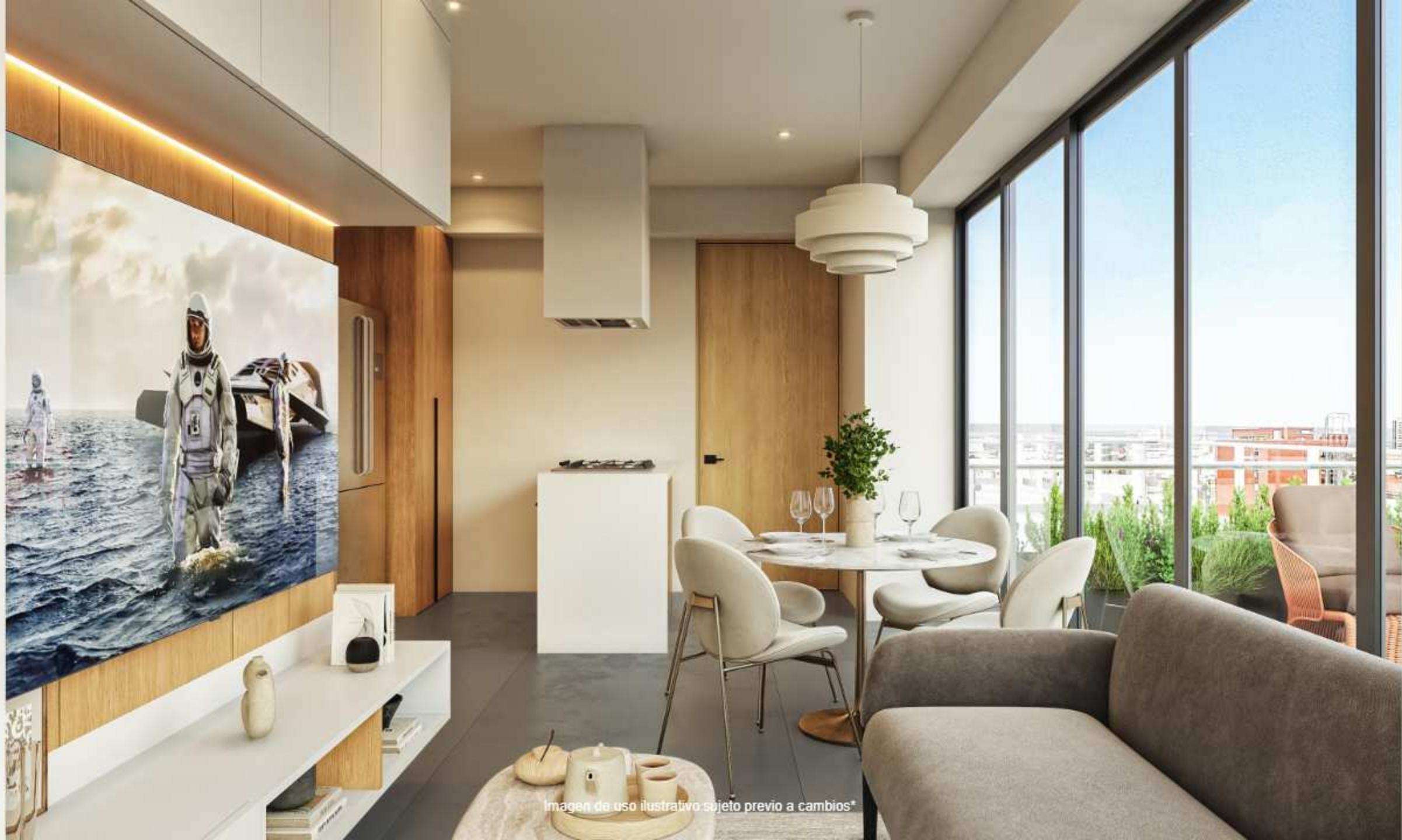
Imagen de uso ilustrativo sujeto previo a cambios*