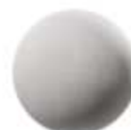
Aplanado de yeso