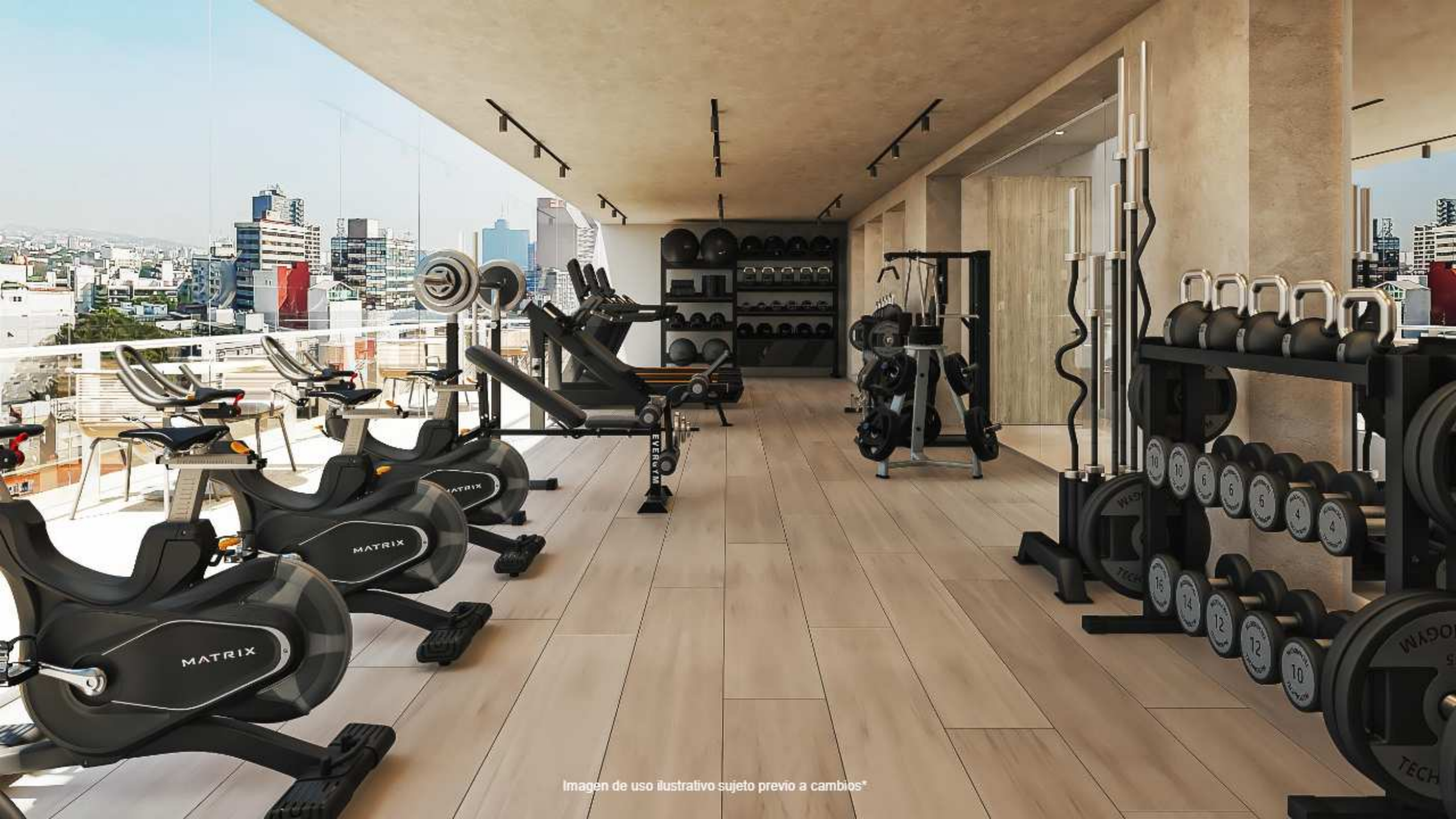
Imagen de uso ilustrativo sujeto previo a cambios*