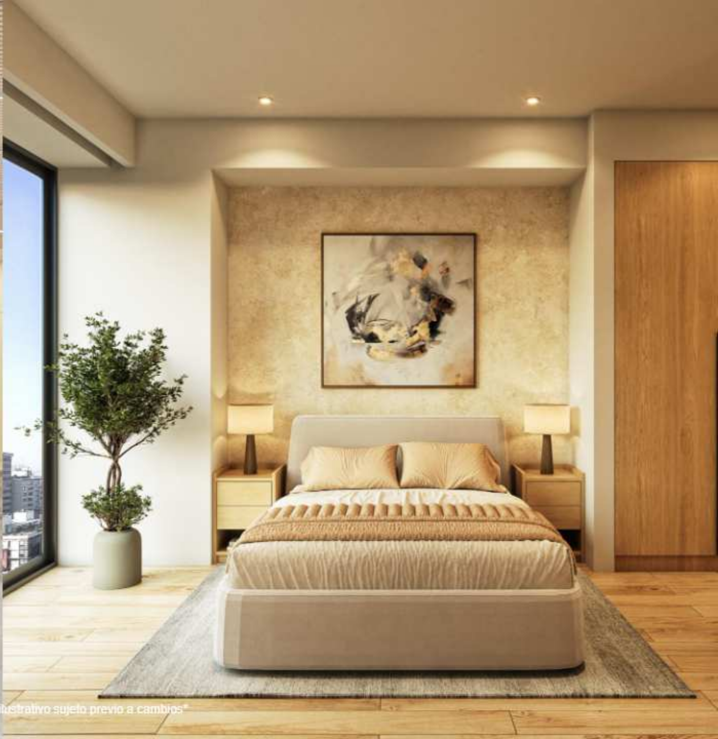
Imagen de uso ilustrativo sujeto previo a cambios*