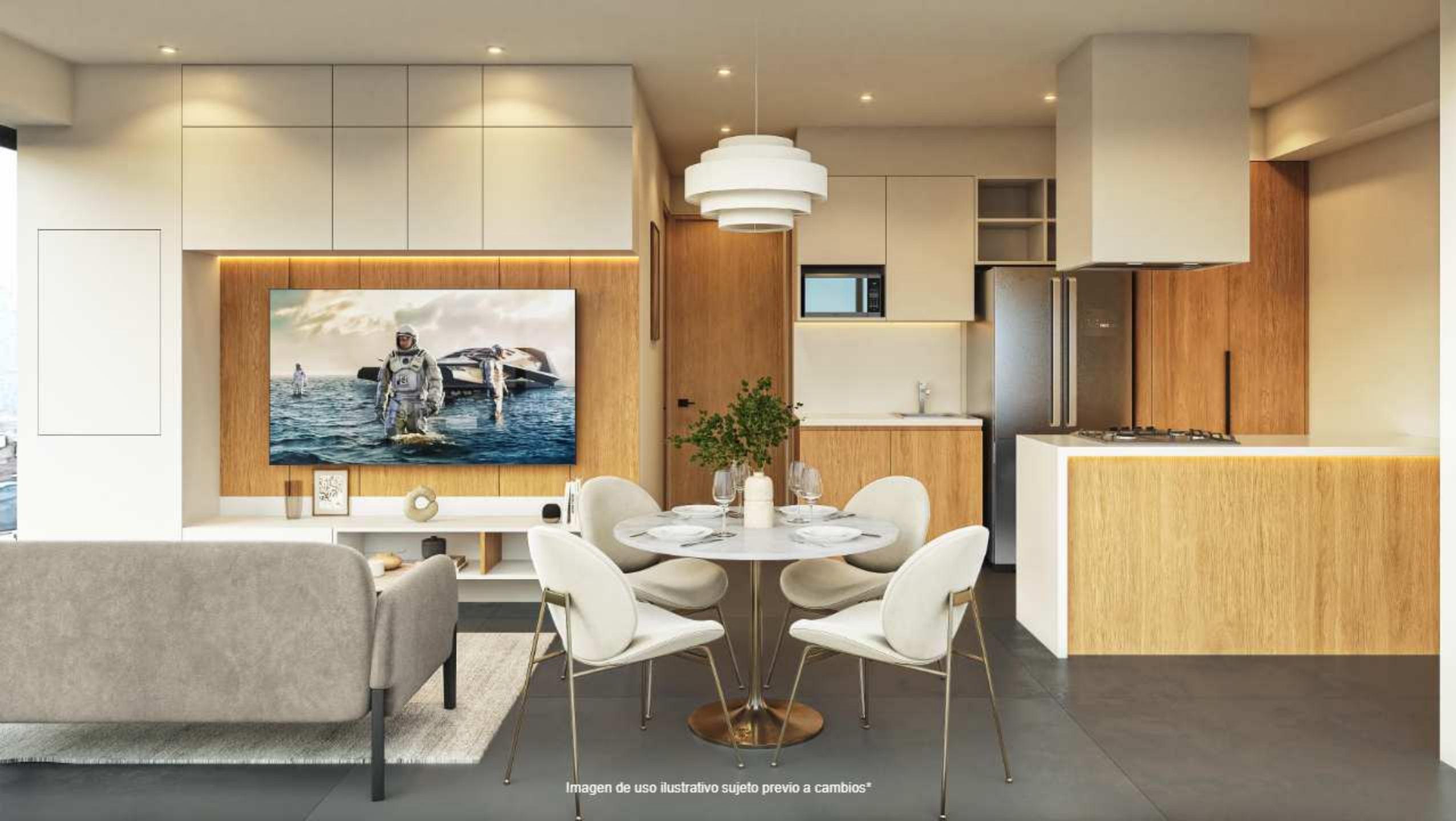
Imagen de uso ilustrativo sujeto previo a cambios*